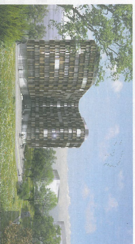
Geplant in Mailand/Milano: Eine Stadt im Wandel

nehmen im norditalienischen Raum, in der Ostschweiz und in Nordtirol in Position gebracht. Der größte Markt hat sich derweil im Mailänder Raum offenbart: Dort bauen die Pusterer im Hinblick auf die Expo 2015 Objekte, die den Rahmen der Vorstel-