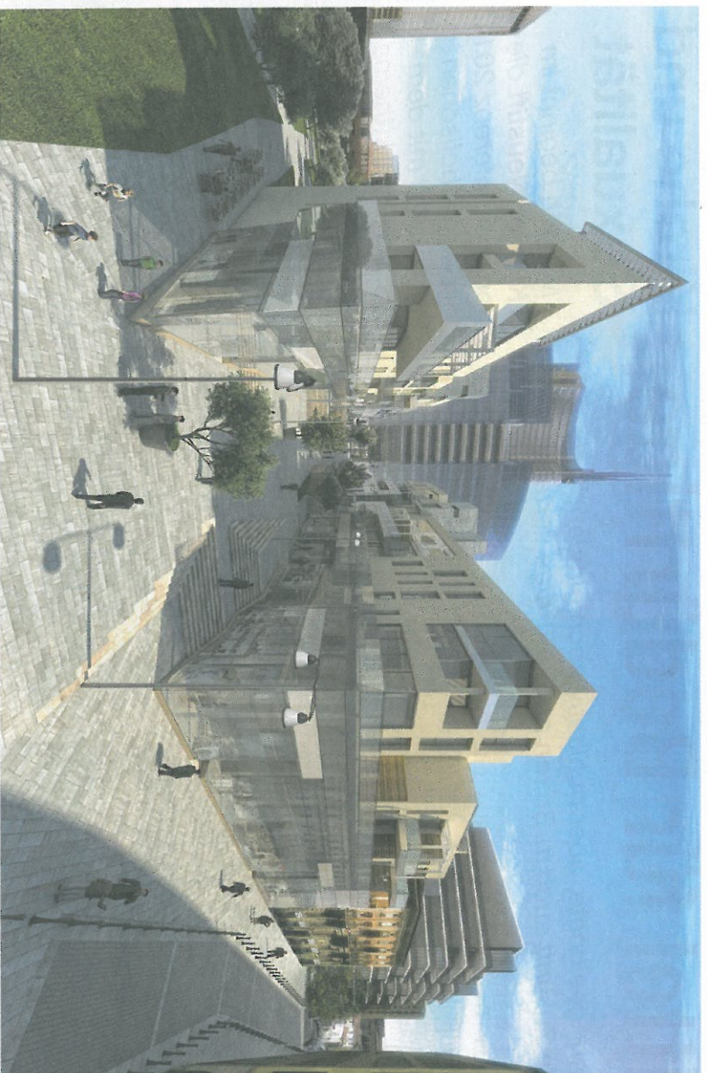
Projekt im Corso Como: Großer Umsatz